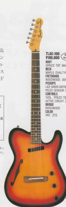
COLOR = 3TS

ACTIVE CONTROL SYSTEM ピエゾセンサーのサウンドを生かすオリジナルサーキットを内蔵したコントロール、あくまでもナチュラルなニュアンスを提供する。