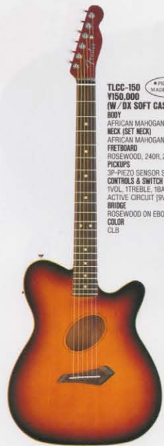
COLOR = CLB

ソリッド・アフリカン・マホガニー材から削り出したホロタイプボディ、そしてネックを持たせたセットネック・エレクトリック・アコースティック・モデル、TLCC。ニュースタイルのサウンドホール、ピエゾ・センサー内蔵ブリッジ&サドル、広範囲な音域をコントロールする専用プリアンプにより、豊かな鳴りのビュア・アコースティック・サウンドを放出します。