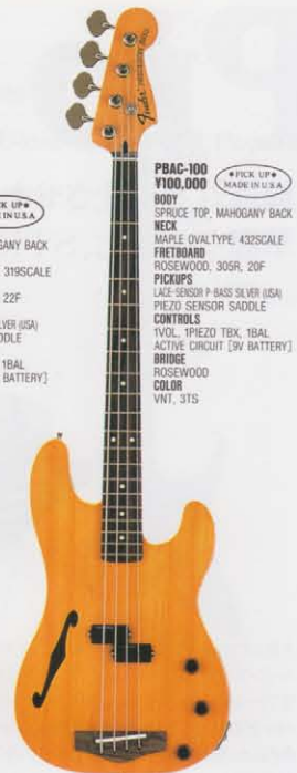
COLOR = VNT

TLCC-100 ¥100,000 (PICK UP*) MADE IN U.S.A. BODY SPRUCE TOP, MAHOGANY BACK NECK MAPLE OVALTYPE, 31.9SCALE FRETBOARD ROSEWOOD, 30.5R, 22F PICKUPS LACE-SENSOR BURTON SILVER (USA) PIEZO SENSOR SADDLE CONTROLS TVOL, TPIEZO TBX, 18AL ACTIVE CIRCUIT [9V BATTERY] BRIDGE ROSEWOOD COLOR VNT, 3TS