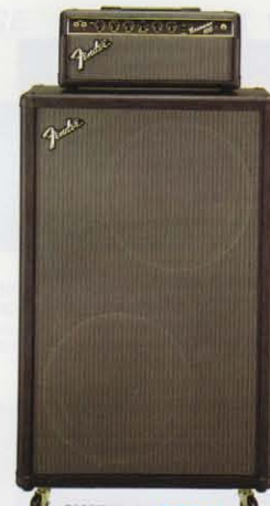
BASSMAN 100 (数量限定)

エレクトロボイス・スピーカー搭載、圧倒的なパワー、250Wを放出するプロモデル。