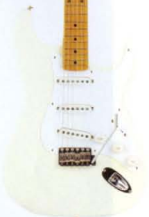
COLOR = VWH

● PICK UP ● ● MADE IN U.S.A. ● BODY BASSWOOD NECK MAPLE OVALTYPE, 324SCALE FRETBOARD MAPLE ONE PIECE, 184R, 21F PICKUPS ST-SINGLE CONTROLS & SWITCH 1VOL, 2TONE, 3WAY SW BRIDGE DIECAST BLOCK S88 COLOR T, BLK, VWH, CAR