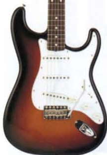
COLOR = 3TS

● PICK UP ● ● MADE IN U.S.A. ● BODY ALDER (LACQUER FINISH) NECK MAPLE OVALTYPE, 324SCALE FRETBOARD ROSEWOOD, 184R, 21F PICKUPS ST-VINTAGE (USA) CONTROLS & SWITCH 1VOL, 2TONE, 3WAY SW (USA) BRIDGE STEEL BLOCK SBF VINTAGE COLOR 3TS, BLK, VWH, CAR