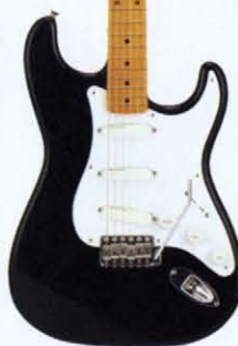
COLOR = BLK

● PICK UP ● ● MADE IN U.S.A. ● BODY ALDER NECK MAPLE, OVALTYPE, 324SCALE FRETBOARD MAPLE ONE PIECE, 184R, 21F PICKUPS LACE-SENSOR GOLD (USA) CONTROLS & SWITCH 1VOL, 1TONE, 1MID BOOST, 3WAY SW ACTIVE CIRCUIT [006P 9V BATTERY] BRIDGE DIECAST BLOCK S50 VINTAGE COLOR T, BLK, PTR