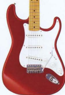
COLOR = CAR

● PICK UP ● ● MADE IN U.S.A. ● BODY BASSWOOD NECK MAPLE OVALTYPE, 324SCALE FRETBOARD MAPLE ONE PIECE, 184R, 21F PICKUPS ST-VINTAGE (USA) CONTROLS & SWITCH 1VOL, 2TONE, 3WAY SW BRIDGE DIECAST BLOCK S50 VINTAGE COLOR T, BLK, VWH, CAR