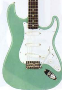
COLOR = SGR

● PICK UP ● ● MADE IN U.S.A. ● BODY ALDER NECK MAPLE, OVALTYPE, 324SCALE FRETBOARD ROSEWOOD, 184R, 21F PICKUPS LACE-SENSOR GOLD (USA) CONTROLS & SWITCH 1VOL, 1TONE, 1MID BOOST, 3WAY SW ACTIVE CIRCUIT [006P 9V BATTERY] BRIDGE DIECAST BLOCK S50 VINTAGE COLOR 3TS, VWH, SGR