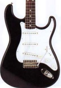
COLOR = BLK

● PICK UP ● ● MADE IN U.S.A. ● BODY BASSWOOD NECK MAPLE OVALTYPE, 324SCALE FRETBOARD ROSEWOOD, 184R, 21F PICKUPS ST-SINGLE CONTROLS & SWITCH 1VOL, 2TONE, 3WAY SW BRIDGE DIECAST BLOCK S88 COLOR 3TS, BLK, VWH, CAR