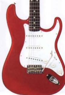
COLOR = CAR

● PICK UP ● ● MADE IN U.S.A. ● BODY BASSWOOD NECK MAPLE OVALTYPE, 324SCALE FRETBOARD ROSEWOOD, 184R, 21F PICKUPS ST-VINTAGE (USA) CONTROLS & SWITCH 1VOL, 2TONE, 3WAY SW BRIDGE DIECAST BLOCK S50 VINTAGE COLOR 3TS, BLK, VWH, CAR