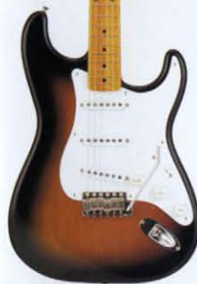
COLOR = T

● PICK UP ● ● MADE IN U.S.A. ● BODY ALDER (LACQUER FINISH) NECK MAPLE OVALTYPE, 324SCALE FRETBOARD MAPLE ONE PIECE, 184R, 21F PICKUPS ST-VINTAGE (USA) CONTROLS & SWITCH 1VOL, 2TONE, 3WAY SW (USA) BRIDGE STEEL BLOCK SBF VINTAGE COLOR T, BLK, VWH, CAR