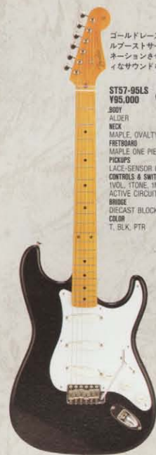
COLOR = BLK

ST57-53 ¥53,000 BODY BASSWOOD NECK MAPLE, OVALTYPE, 324SCALE FRETBOARD MAPLE ONE PIECE, 184R, 21F PICKUPS ST-SINGLE CONTROLS & SWITCH 1VOL, 2TONE, 5WAY SW BRIDGE DIECAST BLOCK S85 COLOR T, BLK, VWH, CAR