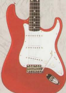
COLOR = CAR