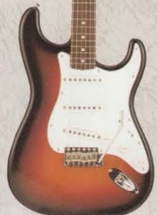
COLOR = 3TS

ST57-110 ¥110,000 ★ PICK UP ★ MADE IN U.S.A. BODY ALDER (LACQUER FINISH) NECK MAPLE, OVALTYPE, 324SCALE FRETBOARD MAPLE ONE PIECE, 184R, 21F PICKUPS ST-VINTAGE (USA) CONTROLS & SWITCH 1VOL, 2TONE, 5WAY SW (USA) BRIDGE STEEL BLOCK S8F VINTAGE COLOR T, BLK, VWH, CAR