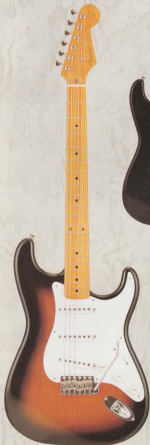
COLOR = T

アメリカンサウンドを生み出すフェンダーUSAビンテージ・ピックアップアセンブリを搭載させた'62ストラトキャスター。