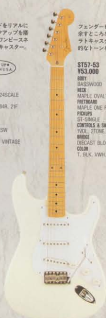
COLOR = VWH