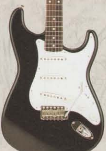
COLOR = BLK