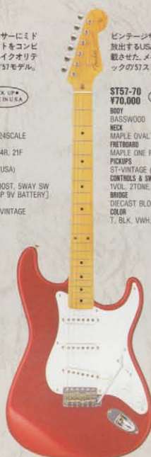
COLOR = CAR