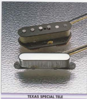
TEXAS SPECIAL TELE

BODY : LIGHT WEIGHT ASH NECK : MAPLE OVALTYPE, 324SCALE FRETBOARD : MAPLE ONE PIECE, 184R, 21F PICKUPS : TEXAS SPECIAL TELE(USA) x 2 CONTROLS & SWITCH : 1VOL. 1TONE, 3WAY SW BRIDGE : 3 SECTION T8 BRASS SADDLE COLOR : VNT