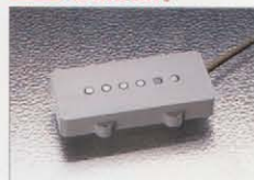
Seymour Duncan PICKUPS

「あのベンチャーズのサーフ・トーンです。」このジャズマスター用ピックアップ「SJM-1」のサウンド・キャラクターを説明する場合、ピックアップの開発者、セイモア・ダンカンには、このように表現します。