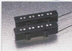
USA VINTAGE JAZZ BASS

トーンレンジを広げる8基のポールピースを持ったフェンダーUSAオリジナル・ジャズベース・ピックアップのホワイトカバー・バージョン。輪郭のはっきりした良質なビンテージ・サウンドを放出します。(写真は黒カバータイプです)