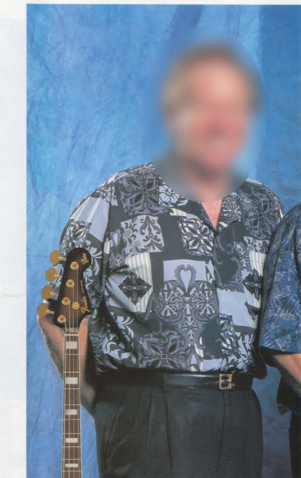
THE VENTURES Bob Bogle

トーンレンジを広げる8基のポールピースを持ったフェンダーUSAオリジナル・ジャズベース・ピックアップのホワイトカバー・バージョン。輪郭のはっきりした良質なビンテージ・サウンドを放出します。(写真は黒カバータイプです)