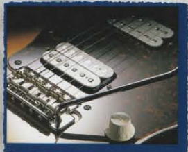
Humbucking Pick-ups & Vintage Tremolo

BODY : BASSWOOD NECK : MAPLE OVALTYPE SCALE : 305 SCALE FRETBOARD : ROSEWOOD, 184R NUMBER OF FRETS : 22 FRETS PICKUPS : Front / DRAGSTER(WH-OPEN) Rear / DRAGSTER(WH-OPEN) BRIDGE : DIECAST BLOCK SSD VINTAGE MACHINE HEADS : VINTAGE TYPE PICKGUARD : TORTOISE SHELL TYPE 3P CONTROLS : 1VOL, 1TONE SWITCH : 3WAY TOGGLE SW COLOR : 3TS, BLK, VWH, CAR, SBL (*'97 後半よりヘッドアジャスト・ネックに仕様変更いたします。)