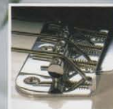
Four Saddle String Through Body Bridge

BODY : ALDER NECK : MAPLE OVALTYPE SCALE : 305 SCALE FRETBOARD : ROSEWOOD, 184R NUMBER OF FRETS : 19 FRETS PICKUPS : VISTA TONE MB BRIDGE : 4 SECTION VINTAGE(STRING-THROUGH-BODY) MACHINE HEADS : VINTAGE TYPE PICKGUARD : WHITE 3P CONTROLS : 1VOL, 1TONE COLOR : BLK, AWT, SBL, SPK