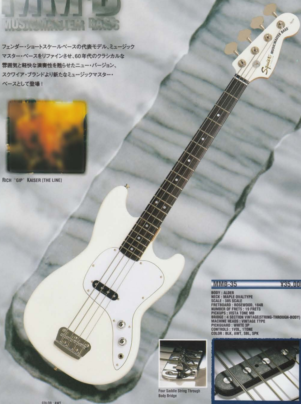
COLOR : AWT