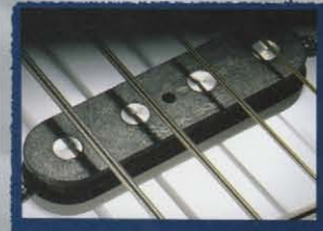
Vista Tone Single Coil Pickup