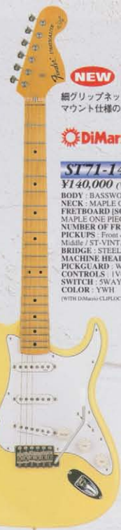
COLOR : YWH

BODY : BASSWOOD NECK : MAPLE OVALTYPE, 324SCALE FRETBOARD [SCALLOPED]: MAPLE ONE PIECE, 250R NUMBER OF FRETS : 21, SUPER JUMBO PICKUPS : Front & Rear / DiMarzio HS-3 Middle / ST-VINTAGE BRIDGE : STEEL BLOCK S8F VINTAGE MACHINE HEADS : VINTAGE STYLE PICKGUARD : WHITE 1P CONTROLS : 1VOL, 2TONE SWITCH : 5WAY COLOR : YWH, PYW (WITH DIMARZIO CLIPLOCK STRAP)