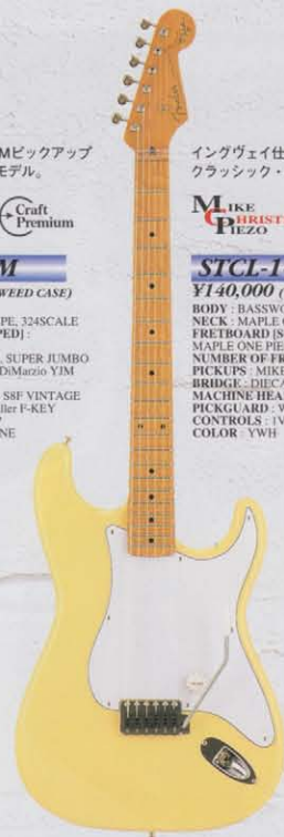
COLOR : YWH