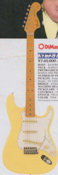
COLOR : YWH