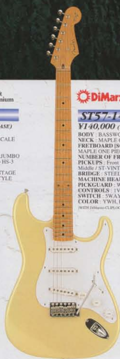
COLOR : PYW