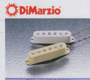
DiMarzio HS-3 &amp; YJM

ディマジオがイングウェイのために開発したピックアップ、HS-3、ST57モデルには白カバータイプ、ST62、ST72、STWモデルにはミントグリーンカバータイプのものをフロントとリアにセットしてあります。ST71には、ヴァンテージ・マグネット・スタaggerを採用したニュービックアップYJMを搭載。