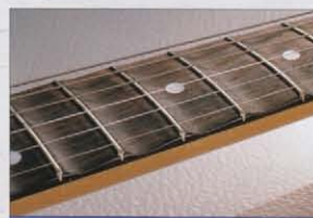
ORIGINAL CUT SCALLOPED

リッチーの早弾き奏法をサポートするスキャロップド・指板。ちょうど帆立貝の表面のように波形にフレットボードをえぐった指板で両モデルとも同じ加工がされています。