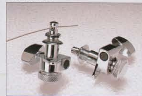
Schaller M6-LB (BOTTOM LOCK)

ベグの裏側の弦ロックつまみを回し、表側のシャフト弦通し穴でロックし、弦のスレによるチューニングの狂いをなくします。ST-175RBに標準装備されています。