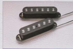
Seymour Duncan SSL-4

1/4インチ・マグネットとパワフルなコイル・ターンにより2倍以上のパワーと素晴らしいサステインが得られ、音量調節によりフレットでパンチの効いたサウンドとクリーン・サウンドの使い分けができるピックアップ。ST72-145RBに標準装備されています。