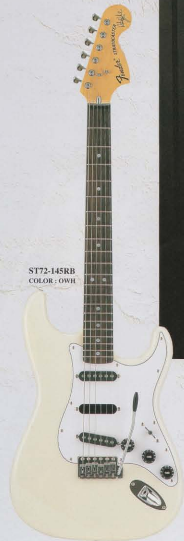
ST72-145RB COLOR: OWH