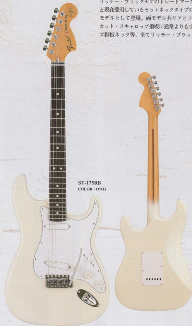
ST-175RB COLOR: OWH

リッチー・ブラックモアのトレードマークともいえる'72タイプのストラトキャスターと現在愛用しているセットネックタイプのストラトキャスターが、遂にシグネチャー・モデルとして登場。両モデル共リアとフロントの2ピックアップ構成で、オリジナルカット・スキャロップ指板に通常よりも少し薄く細身に仕上げたネックグリップのローズ指板ネック等、全てリッチー・ブラックモア仕様になっています。