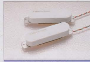
FENDER GOLD LACE SENSOR

極めてクリアで上質なビテンジ・サウンドをローノイズに再現するフェンダー・レースセンサー「ゴールデン・ストラト」を採用したST-175RB。