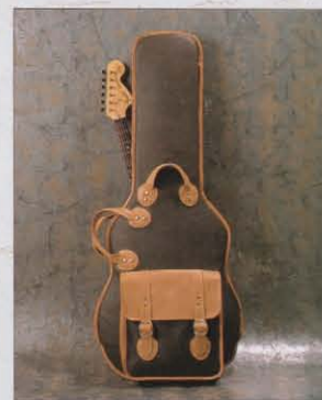
CUSTOM GIG CASE

ベグの裏側の弦ロックつまみを回し、表側のシャフト弦通し穴でロックし、弦のスレによるチューニングの狂いをなくします。ST-175RBに標準装備されています。