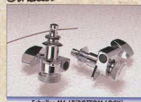
Schaller M6-LB (BOTTOM LOCK)

リッチーの早弾き奏法をサポートするスキャロップド・指板。ちょうど軌立具の表面のように波形にフレットボードをえぐった指板で両モデルとも同じ加工がされています。