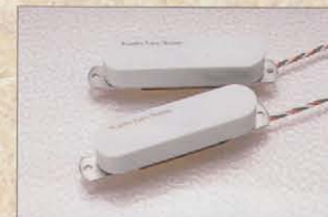
FENDER GOLD LACE SENSOR

極めてクリアで上質なビンテージ・サウンドをローノイズに再現するフェンダー・レースセンサー「ゴールデン・ストラト」を採用したST-175RB。