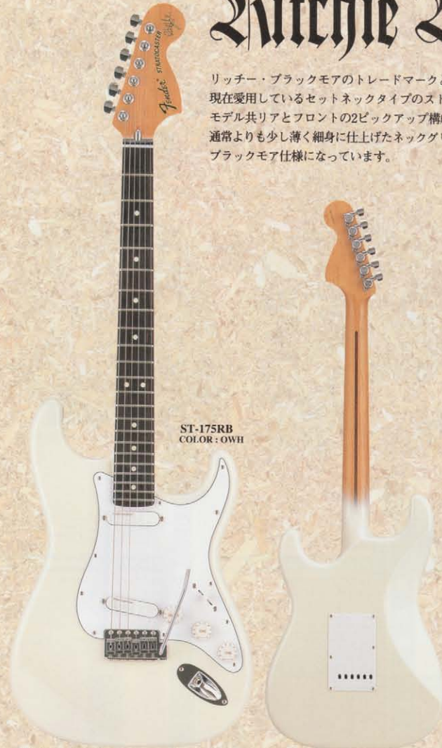
ST-175RB COLOR: OWH

極めてクリアで上質なビンテージ・サウンドをローノイズに再現するフェンダー・レースセンサー「ゴールデン・ストラト」を採用したST-175RB。