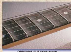
ORIGINAL CUT SCALLOPED

リッチーの早弾き奏法をサポートするスキャロップド・指板。ちょうど軌立具の表面のように波形にフレットボードをえぐった指板で両モデルとも同じ加工がされています。