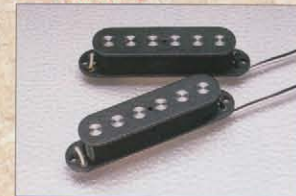
Seymour Duncan SSL-4

1/4インチ・マグネットとパワフルなコイル・ターンにより2倍以上のパワーと素晴らしいサステインが得られ、音量調節によりファットでパンチの効いたサウンドとクリーン・サウンドの使い分けができるピックアップ。ST72-145RBに標準装備されています。