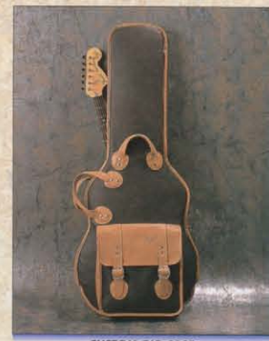
CUSTOM GIG CASE

ベグの裏側の弦ロックつまみを回し、表側のシャフト弦通し穴でロックし、弦のスレによるチューニングの狂いをなくします。ST-175RBに標準装備されています。