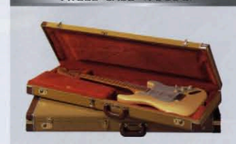
TWEED CASE (TC-33G)

ST68-185YMとST71-140YMの両モデル共、ベアシックでハヴィューティなファンダーツイードクロス・ハードケースが付属されています。