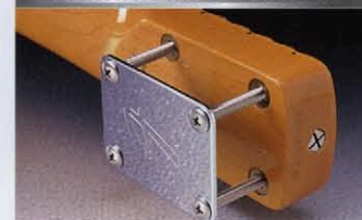
ANCHOR MOUNTED NECK JOINT

イングヴェイのギターに施されているモディファイとして、スキャロップドと共にそのサウンド、トーンに大きく影響しているマジック・スベック、ネックとボディをタイトに密着させるアンカーボルト・ネックジョイントシステムをST68モデルに採用。