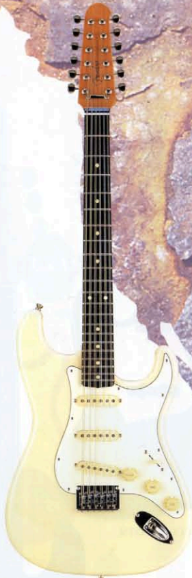
COLOR : VWH