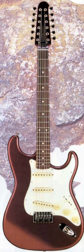
COLOR : BMT

アルダーボディにテキサス・スペシャル・ピックアップを搭載し、魅力的なストラトサウンドを備えた12弦仕様のストラトキャスター。