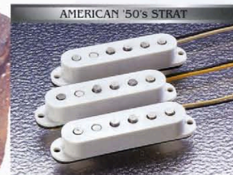
COLOR : 2T

BODY : LIGHT WEIGHT ASH NECK : MAPLE V TYPE, 324SCALE FRETBOARD : MAPLE ONE PIECE, 184R, 21F PICKUPS : AMERICAN '50s (U.S.A.) × 3 CONTROLS & SWITCH : 1VOL, 2TONE, 5WAY SW BRIDGE : STEEL BLOCK S8F VINTAGE COLOR : 2T, BLK