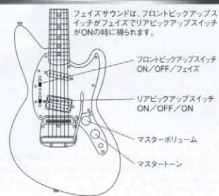
JAG-70 CONTROLS & SWITCH

BODY: BASSWOOD / NECK: MAPLE, OVAL TYPE, 30.5 SCALE FRETBOARD: ROSEWOOD, 18.4R, 22F PICKUPS: ST-VINTAGE(neck), DRAGSTER-J(bridge) CONTROLS: 1 VOL, 1 TONE SWITCH: F-PU ON/OFF/PHASE, R-PU ON/OFF/ON BRIDGE: DYNAMIC VIBRATO / COLOR: FRD, SBL