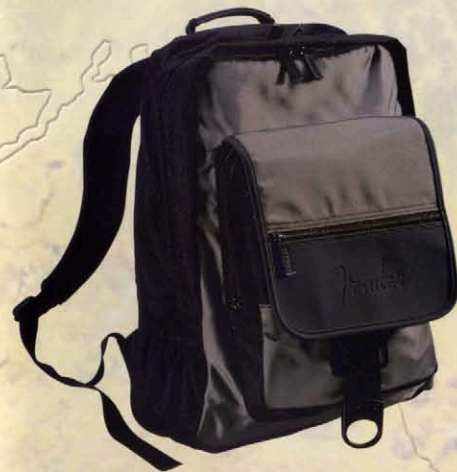
Compu-Backpack #465 ¥9,000