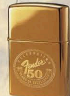
FENDER 50th ANNIVERSARY ZP-510 ¥6,500 (数量限定品)