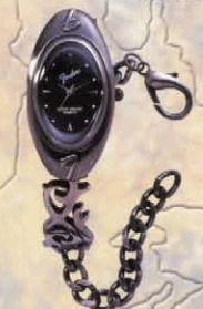
SD-991 Modern Black