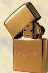
FENDER LOGO GOLD ZP-509 ¥6,500