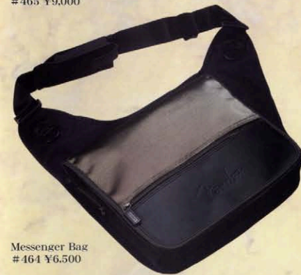
Messenger Bag #464 ¥6,500