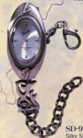
SD-992 Silky Silver