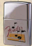
FENDER NOTES ZP-718 ¥5,500 (数量限定品)