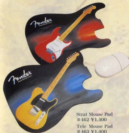
Strat Mouse Pad #462 ¥1,400 Tele Mouse Pad #463 ¥1,400