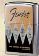
'57 CATALOG ZP-717 ¥5,500 (数量限定品)