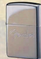
FENDER LOGO CHROME ZP-508 ¥4,500