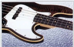
Curly Maple Laminated Top

エアロダイ・スペシャル・シリーズのボディは、優れた演奏性を追求した結果、エアロダイ・シリーズで実証された高い演奏性が得られる曲面仕上げのボディトップに加え、ボディバックにも曲面仕上げを施した特徴的なスタイル。