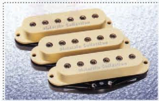
Heavy Drive Pickups DCS-2

「ヘヴィ・ドライブDCS-2」は、シングルコイルながらハイアウトプットで分厚い中・低域を持つピックアップ、ハイゲインでありながら、切れる鋭い高域を併せ持ち、シングルコイルならではのスケの良いサウンドを特徴としている。