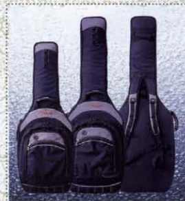
SPECIAL GIG BAG

「スヴォトドライブDCJ-2, DCF-2」はハイアウトプットで分厚いミッドレンジを備えながら、ベースのグルーブに影響するアタック感の重要性を認識した、ヘヴィでありながらも音の演れを排除したサウンド・デザインを特徴としている。