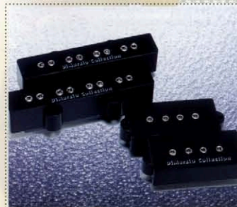
Heavy Drive Pickups DCJ-2, DCF-2

「スヴォトドライブDCJ-2, DCF-2」はハイアウトプットで分厚いミッドレンジを備えながら、ベースのグルーブに影響するアタック感の重要性を認識した、ヘヴィでありながらも音の演れを排除したサウンド・デザインを特徴としている。