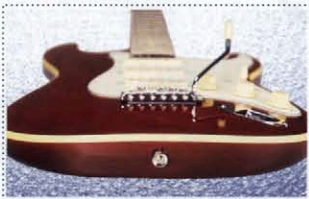
Round Top & Back Body

「ヘヴィ・ドライブDCS-2」は、シングルコイルながらハイアウトプットで分厚い中・低域を持つピックアップ、ハイゲインでありながら、切れる鋭い高域を併せ持ち、シングルコイルならではのスケの良いサウンドを特徴としている。