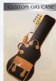
CUSTOM GIG CASE