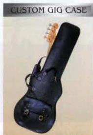
CUSTOM GIG CASE

パッシブ、アクティブの切替ミニスイッチを持つコントロール。パッシブ時はメタルノブのフロント、リアのボリュームのみ、アクティブ時には黒ノブのベースとトレブルのコントロールが加わる。