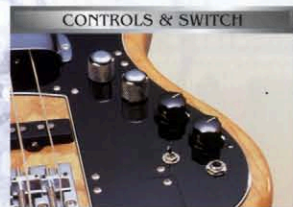
CONTROLS & SWITCH

BODY: ASH NECK: MAPLE OVAL TYPE (w/White Binding), 432 SCALE FRETBOARD: MAPLE ONE PIECE, 184R, 20F PICKUPS: J-BASS VINTAGE (U.S.A.) × 2 / PICKGUARD: BLACK 3P CONTROLS & SWITCH: 2 VOL, 1 TREBLE, 1 BASS, ACTIVE / PASSIVE SW CIRCUIT: FMDQ (2Band Active EQ) (006P 9V BATTERY) BRIDGE: BADASS II CHROME COLOR: NAT