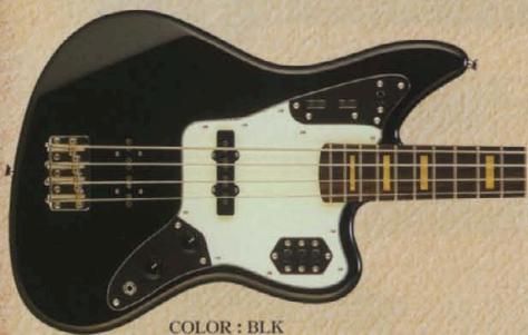
COLOR : BLK