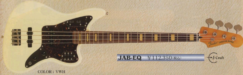
COLOR : VWH