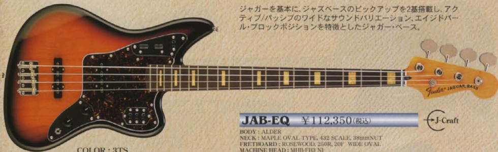
COLOR : 3TS

ジャガーを基本に、ジャズベースのピックアップを2基搭載し、アクティブ/パッシブのワイドなサウンドバリエーション、エイジドバルブ・ブロックポジションを特徴としたジャガー・ベース。