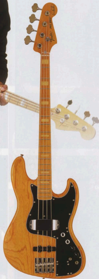
COLOR : NAT

パッシブ、アクティブの切替ミニスイッチを持つコントロール。パッシブ時はメタルノブのフロント、リアのボリュームのみ、アクティブ時には黒ノブのベースとトレブルのコントロールが加わる。