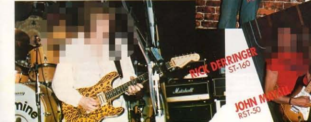
RICK DERRINGER ST-160