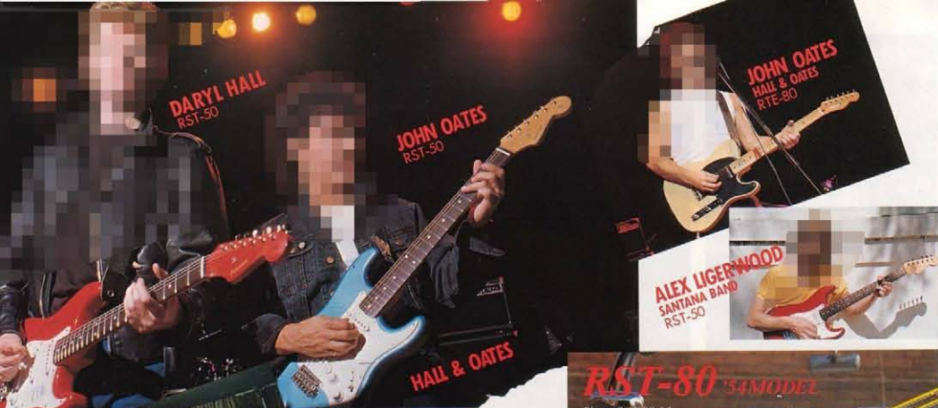
DARYL HALL RST-50