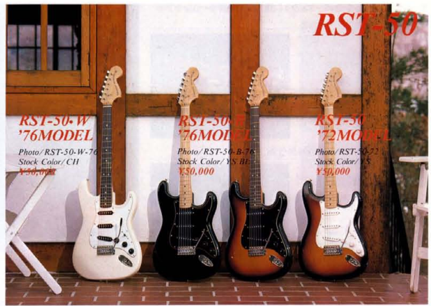
RST-50-W '76MODEL Photo/ RST-50-W-76 Stock Color: CH ¥50,000

アルダー材は非常に軽重でしかも繊維組織はむらりがあり、ボディ材としては最適な条件を備えている。アルダー材としては、アメリカはオレゴン州、ワシントン州から輸入したアルダー材をセレクトして使用。RST-60 '66 '50 '76のConlon Comforter Bodyはアルダー材のワイドウェイットと相まって演奏性を一段と高めてくれるゾ！