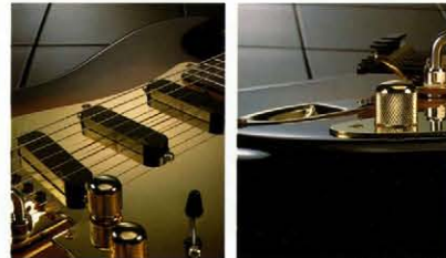
SPCコントロールノブ

そして、このEMG-SAに専用のヘッドレンジをイコライズ・ブーストさせるSPCが作動。深みのあるハムバックサウンドに変身するのだ。SPCノブをいっばいに絞り込むと、ハイバス状態でEMG-SA本来のサウンド。フルレンジの状態では2,000Hz時出力は6dBブーストされ、シングルノートでの演奏時においても蓋やせずに、太いハムバックサウンドを創り出す。そしてフィニッシュ・チューナー作動HEAD CRASHER FRT-6をマウント、世界No.1ランキングのEMG、HEAD CRASHER、完璧なボディネック・スベックを持つこのFST-135はまさにキング・オブ・ギターだ。