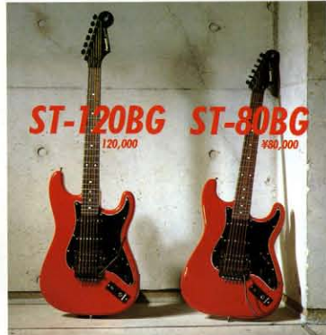
ST-120BG 120,000 ST-80BG ¥80,000

切れこもろな鉄フレームに、リゾーナーアームを標準とする「セミブラッド・ギルム」の無畏なギターが、このST-155BGだ。レイド & ブラックのボディ・コントラストにセイモア・アダンカンのハブ & プライム・インパルサー・ウォーム & タイプ1ダブルピックアップをマウント。そして、何となく決め手は大型なア