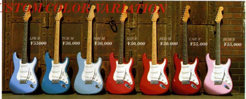
LPB R ¥55,000 TUB M ¥50,000 SOB M ¥50,000 SAP R ¥50,000 RED M ¥50,000 CAR R ¥55,000 BUM R ¥55,000

写真はカスタムカラーのワリエーションです。LPB、LFB、RFBのカラーはワリエーションについては定価¥50,000円アップでオーダーすることができます。その他のカスタムカラーについては価格アップせずにオーダーすることができます。又、RST、RTE、RFB、RJBについても同様です。