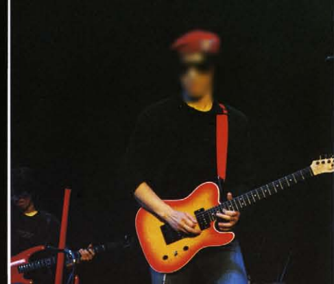
JUNIICHI YASHIMA (HOUND DOG)