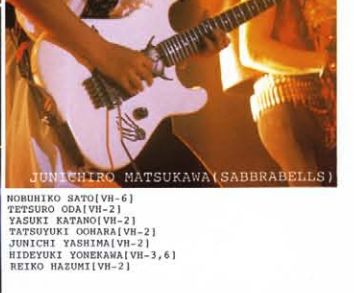
NORUHIKO SATO (VH-6) TETSURO ODA (VH-2) YASUKI KATANO (VH-2) TATSUYUKI OOHARA (VH-2) JUNIICHI YASHIMA (VH-2) HIDEYUKI YONEKAWA (VH-3,6) REIHO HARUMI (VH-2)