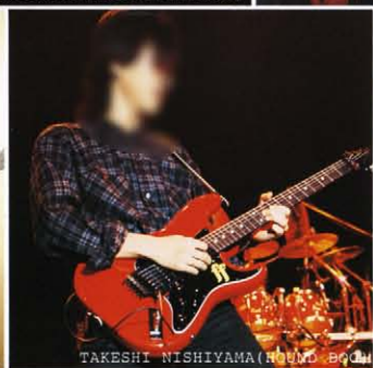
TAKESHI NISHIYAMA (HOUND DOG)