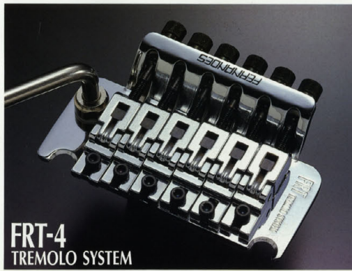
FRT-4 TREMOLO SYSTEM