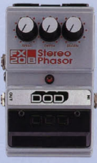
FX-20B ¥13,000 STEREO PHASOR

FX-50の基本ベース・サウンドを引き継ぎ更にシフト・ディレイ(0~40msec)を内蔵したユニット。このディレイのコントロールによって簡単に厚みと盛りを持たせることができる。トランジスタアンプとのマッチングも良く、音があまるサウンドを演出する。