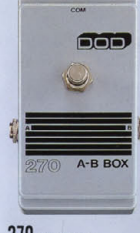
270 A-B BOX ¥4,500

ベース専用設計された低域重視のコンパクト・タイプ。グラフィックEQ。2バンド・コントロール。音質のニュアンスを要することなく、ナチュラルに伸びやがなりステインと、ツブの削った音を削り出す。単体として使うだけでなく、オクターバーの安定したハイパス、ディレイ・コンパニオンの機能も搭載している。スピークが非常に細かいため、厚い効果を生み出す。スピークが非常に細かいため、厚い効果を生み出す。