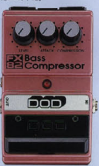
FX-82 ¥11,500 BASS COMPRESSOR

ベース専用設計された低域重視のコンパクト・タイプ。グラフィックEQ。2バンド・コントロール。音質のニュアンスを要することなく、ナチュラルに伸びやがなりステインと、ツブの削った音を削り出す。単体として使うだけでなく、オクターバーの安定したハイパス、ディレイ・コンパニオンの機能も搭載している。スピークが非常に細かいため、厚い効果を生み出す。スピークが非常に細かいため、厚い効果を生み出す。