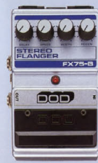
FX-75B ¥16,000 STEREO FLANGER

このFX-65は音質と音色が素晴らしい。コースト・サウンドは従来のコーストとは異なるものである。音域の広いハモニーが生まれてくる。音域の広いハモニーが生まれてくる。音域の広いハモニーが生まれてくる。音域の広いハモニーが生まれてくる。