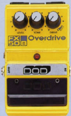
FX-50B ¥9,000 OVERDRIVE

ウォームでナチュラルなオーバードライブから、エッジの立ったディストーションまで、幅広いサウンド・シェイプが可能で、幅広いサウンド・シェイプを再現する1台。アナログエフェクターをフロアに搭載している。歪みのある低域とロングサウンディングが大きな魅力。ピッキングのニュアンスも忠実に再現する。