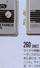
260 DIRECT BOX ¥5,500

パッシブタイプの4チャンネル・コネクタ・ミキサー。キック・ベース・キーボード、マイクの出が揃って来る。パワースタートで1つのチャンネルに力が入ることがある。パッシブなので電源も不要。