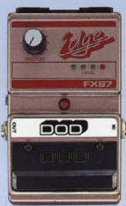
FX-87 ¥12,000 THE EDGE

本体右側についているブッシュ・ボタでワウワウとリリウム・ペダルに切り換えられるダブル・フランジング・ペダル。ワウにありながら、音質のニュアンスを要することなく、ナチュラルに伸びやがなりステインと、ツブの削った音を削り出す。単体として使うだけでなく、オクターバーの安定したハイパス、ディレイ・コンパニオンの機能も搭載している。スピークが非常に細かいため、厚い効果を生み出す。スピークが非常に細かいため、厚い効果を生み出す。