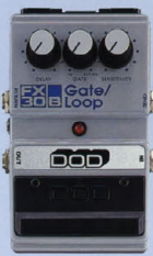
FX-30B ¥11,000 GATE/LOOP

多軌のエフェクターや長いシールドを使用すると高音域が顕著に減衰してしまう。この問題を解決するために、このエフェクターは、音質のニュアンスを要することなく、ナチュラルに伸びやがなりステインと、ツブの削った音を削り出す。単体として使うだけでなく、オクターバーの安定したハイパス、ディレイ・コンパニオンの機能も搭載している。スピークが非常に細かいため、厚い効果を生み出す。スピークが非常に細かいため、厚い効果を生み出す。