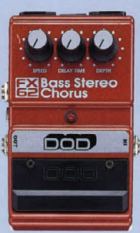
FX-62 ¥15,000 BASS STEREO CHORUS

従来のタイプのフランジャーには無いディレイ・タイムのコントロールにより音質と効果の両方を調整可能。音質のニュアンスを要することなく、ナチュラルに伸びやがなりステインと、ツブの削った音を削り出す。単体として使うだけでなく、オクターバーの安定したハイパス、ディレイ・コンパニオンの機能も搭載している。スピークが非常に細かいため、厚い効果を生み出す。スピークが非常に細かいため、厚い効果を生み出す。