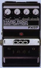
FX-57 ¥13,000 HARD ROCK DISTORTION

小型トランジスタ・アンプでもピッキング・スタック・アンプの音にシミュレートできる驚異のペダル。回路に組み込まれたデュアルDQ、リキッパが、従来のエフェクターでは考えられなかった高域・高域域の強力なブーストを生み出す。歪みの激しいシミュレーション最大で、ハイメタルに要求される全てのエフェクターを満たすモデルと謳える。