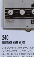
240 RESISTANCE MIXER ¥6,200

A/Bボックス機能とエフェクター機能を1台にまとめ、さまざまな入出力の切り換えをコントロールする多機能なマスター・スイッチだ。