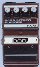
FX-72 ¥16,000 BASS STEREO FLANGER

ベース専用設計された低域重視のコンパクト・タイプ。グラフィックEQ。2バンド・コントロール。音質のニュアンスを要することなく、ナチュラルに伸びやがなりステインと、ツブの削った音を削り出す。単体として使うだけでなく、オクターバーの安定したハイパス、ディレイ・コンパニオンの機能も搭載している。スピークが非常に細かいため、厚い効果を生み出す。スピークが非常に細かいため、厚い効果を生み出す。