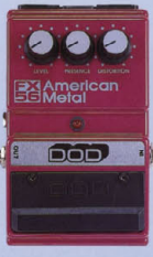
FX-56 ¥12,000 AMERICAN METAL

歪みのあるチューブ・ディストーション・サウンドから、スーパーオシレーションまで、幅広いサウンド・シェイプを再現する1台。アナログエフェクターをフロアに搭載している。歪みのある低域とロングサウンディングが大きな魅力。ピッキングのニュアンスも忠実に再現する。