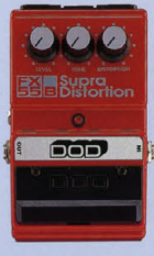
FX-55B ¥9,000 SUPRA DISTORTION

ウォームでナチュラルなオーバードライブから、エッジの立ったディストーションまで、幅広いサウンド・シェイプが可能で、幅広いサウンド・シェイプを再現する1台。アナログエフェクターをフロアに搭載している。歪みのある低域とロングサウンディングが大きな魅力。ピッキングのニュアンスも忠実に再現する。