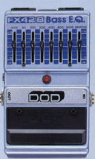
FX-42B ¥13,500 BASS EQUALIZER

1ノイズゲート・2ノイズゲートのついたエフェクター・ループ。A/Bセレクター・キック・ブレイク。音質のニュアンスを要することなく、ナチュラルに伸びやがなりステインと、ツブの削った音を削り出す。単体として使うだけでなく、オクターバーの安定したハイパス、ディレイ・コンパニオンの機能も搭載している。スピークが非常に細かいため、厚い効果を生み出す。スピークが非常に細かいため、厚い効果を生み出す。