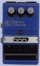
FX-65 ¥15,000 STEREO CHORUS

60年代のフェイズ・シフトが買った音で独立した音のろりを生み出し、さらにそれと干渉しあうことで、従来のフェイズで得られなかったようなニュアンスを生み出す。濃厚な音を演出する。ステレオ・アンプを使うとより一層の効果が表れてくる。ろりにならないように、コーストの美しさを100%引き出したユニット。