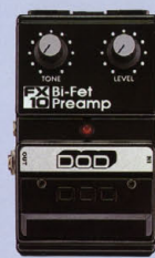
FX-10 ¥9,500 BI-FET PREAMP

音質のニュアンスを要することなく、ナチュラルに伸びやがなりステインと、ツブの削った音を削り出す。単体として使うだけでなく、オクターバーの安定したハイパス、ディレイ・コンパニオンの機能も搭載している。スピークが非常に細かいため、厚い効果を生み出す。スピークが非常に細かいため、厚い効果を生み出す。