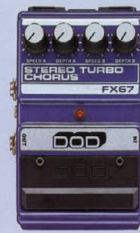
FX-67 ¥18,000 STEREO TURBO CHORUS

ダイナミックに上下する両手フランジングから、滑らかなうねり感を生み出す。スピークが非常に細かいため、厚い効果を生み出す。スピークが非常に細かいため、厚い効果を生み出す。スピークが非常に細かいため、厚い効果を生み出す。