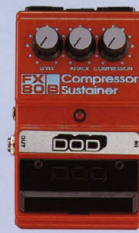
FX-80B ¥11,500 COMPRESSOR/SUSTAINER

10バンド・グラフィック・イコライザー。コンパクト・サイズながら18dBと、上級機・マウント機に匹敵する上級音質・カットが可能。スピークが非常に細かいため、厚い効果を生み出す。スピークが非常に細かいため、厚い効果を生み出す。