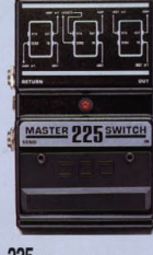
225 MASTER SWITCH ¥10,000

シンプルながらバイパスされたA/Bボックス。演奏のボクシ、また急いでスイッチを使用することにより音を削り、耐久性と信頼性を誇っている。