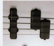
F.G.I.-PJ 1SET ¥22,000 (P.U.×1, プラグインボード×1, トーンポット×1)

F.G.I.-Jは、シングルコイルとハムバッキングの両方のサウンドが必要となるプレイヤーに適した、ハイブリッドタイプのピックアップです。また、ハイブリッドタイプのピックアップは、非常に広いダイナミックレンジを実現し、音の伸びや得られるボリュームを上げていれている。また、F.G.I.-Jはプロット・システムにおいても非常に優秀なため、リアのシステムにVH-1やVH-2を4弦用するなどの構成も可能だ。