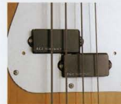
F.G.I.-P 1SET ¥13,000 (P.U.×1, プラグインボード×1, トーンポット×1)

F.G.I.-Tは、シングルコイルとハムバッキングの両方のサウンドが必要となるプレイヤーに適した、ハイブリッドタイプのピックアップです。また、ハイブリッドタイプのピックアップは、非常に広いダイナミックレンジを実現し、音の伸びや得られるボリュームを上げていれている。また、F.G.I.-Tはプロット・システムにおいても非常に優秀なため、リアのシステムにVH-1やVH-2を4弦用するなどの構成も可能だ。