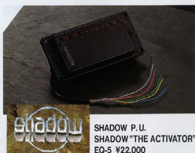
SHADOW P.U. SHADOW "THE ACTIVATOR" EQ-5 ¥22,000