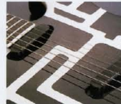
F.G.I.-T 1SET ¥20,000 (P.U.×1, プラグインボード×1, トーンポット×1)

F.G.I.-PJは、シングルコイルとハムバッキングの両方のサウンドが必要となるプレイヤーに適した、ハイブリッドタイプのピックアップです。また、ハイブリッドタイプのピックアップは、非常に広いダイナミックレンジを実現し、音の伸びや得られるボリュームを上げていれている。また、F.G.I.-PJはプロット・システムにおいても非常に優秀なため、リアのシステムにVH-1やVH-2を4弦用するなどの構成も可能だ。