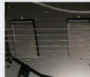
F.G.I.-H 1SET ¥12,000 (P.U.×1, プラグインボード×1, トーンポット×1)

F.G.I.-Pは、シングルコイルとハムバッキングの両方のサウンドが必要となるプレイヤーに適した、ハイブリッドタイプのピックアップです。また、ハイブリッドタイプのピックアップは、非常に広いダイナミックレンジを実現し、音の伸びや得られるボリュームを上げていれている。また、F.G.I.-Pはプロット・システムにおいても非常に優秀なため、リアのシステムにVH-1やVH-2を4弦用するなどの構成も可能だ。