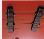
F.G.I.-J 1SET ¥22,000 (P.U.×1, プラグインボード×1, トーンポット×1)

F.G.I.-Sは、シングルコイルとハムバッキングの両方のサウンドが必要となるプレイヤーに適した、ハイブリッドタイプのピックアップです。また、ハイブリッドタイプのピックアップは、非常に広いダイナミックレンジを実現し、音の伸びや得られるボリュームを上げていれている。また、F.G.I.-Sはプロット・システムにおいても非常に優秀なため、リアのシステムにVH-1やVH-2を4弦用するなどの構成も可能だ。