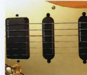
F.G.I.-SH 1SET ¥30,000 (P.U.×1, プラグインボード×1, トーンポット×1)

F.G.I.-SHは、シングルコイルとハムバッキングの両方のサウンドが必要となるプレイヤーに適した、ハイブリッドタイプのピックアップです。また、ハイブリッドタイプのピックアップは、非常に広いダイナミックレンジを実現し、音の伸びや得られるボリュームを上げていれている。また、F.G.I.-SHはプロット・システムにおいても非常に優秀なため、リアのシステムにVH-1やVH-2を4弦用するなどの構成も可能だ。