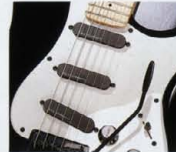
F.G.I.-S 1SET ¥28,000 (P.U.×1, プラグインボード×1, トーンポット×1)

F.G.I.-SHは、シングルコイルとハムバッキングの両方のサウンドが必要となるプレイヤーに適した、ハイブリッドタイプのピックアップです。また、ハイブリッドタイプのピックアップは、非常に広いダイナミックレンジを実現し、音の伸びや得られるボリュームを上げていれている。また、F.G.I.-SHはプロット・システムにおいても非常に優秀なため、リアのシステムにVH-1やVH-2を4弦用するなどの構成も可能だ。