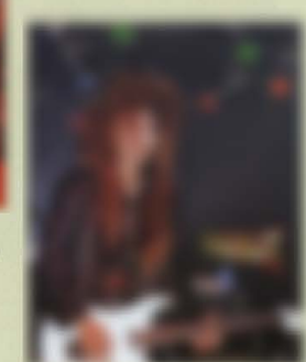
Kazuki AMPHIBIAN FR-855'93 Custom Wood Material:Maple + Rosewood Neck,22F,648mm-Scale, Ses Body Hardware:FR-S1 + VH-4 Pickups,Volume,1 Toggle-SW,Sustainer