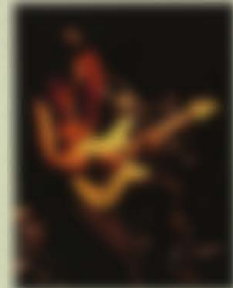
Hiwashi FR Custom Wood Material:Maple + Maple Neck,Light Ash Small Body Hardware:Sustainer