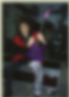
Tom Schmitt STS & MISSION FR-70'91 Custom Wood Material:Maple + Rosewood Neck,24F,648mm-Scale, Soft Maple Body Hardware:DS-3 + DS-3 + ED-5 Pickups,Volume,Tone, 5Way Lever-SW,FRT-4