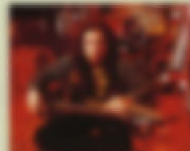
J.Yungler WHITE ZOMBIE FRG-100 USA FR Custom Wood Material:Maple + Rosewood Neck,22F,613mm-Scale,Mahogany Body Hardware:VH-400 Pickups,FRT-4,Sustainer