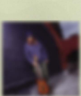
Donny Campbell ELECTRIC LOVE HOCS FRG-100 USA FR Custom Wood Material:Maple + Rosewood Neck,22F,648mm-Scale,Ash Body Hardware:TH-3,THD Pickups,Volume,Tone,5Way Lever-SW, FRT-4,Sustainer