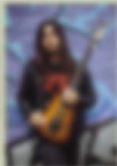
Frank Godwin KREATOR FR-855'93 Custom Wood Material:Maple + Rosewood Neck,22F,648mm-Scale, Ses Body Hardware:THS-1 + HD-1 Pickups,Volume,Tone, 5Way Lever-SW,FRT-4,Sustainer