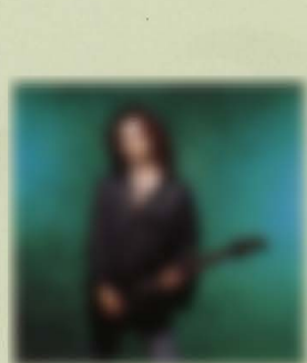
Dweezil Zappa FRG-100 USA FR Custom Wood Material:Maple + Rosewood Neck,22F,648mm-Scale,Ash Body Hardware:TH-5,THD Pickups,Volume,Tone,5Way Lever-SW, FRT-4,Sustainer