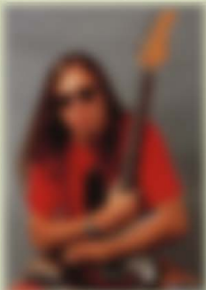
Adam Wacht LEFT FOR DEAD FRG-100 USA FR Custom Wood Material:Maple + Rosewood Neck,22F,648mm-Scale, Ash Body Hardware:TH-5,THD Pickups,Volume,Tone,5Way Lever-SW, FRT-4,Sustainer