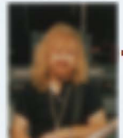
Brad Whitford AEROSMITH