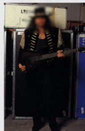
Gary Rossington LYNYRD SKYNYRD

※FSK-401の取り付け加工工程に関しては、特殊な技術を要するため、一括して技術開発費としております。詳しくはフェルナンデス・サステイナー・サービス係までお問い合わせください。 東京:03-3950-8113 大阪:06-374-2929