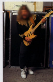
Johnny Van-Zant LYNYRD SKYNYRD