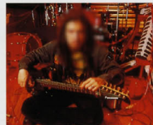
J / WHITE ZOMBIE