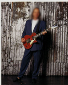
Adrian Belew / KING CRIMSON