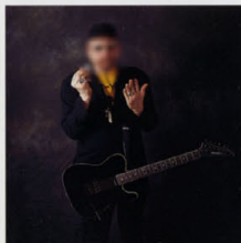
Rick Nielsen / CHEAP TRICK