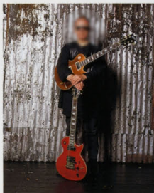
Robert Fripp / KING CRIMSON