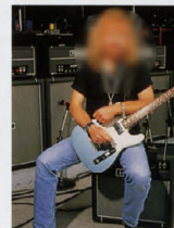
Brad Whitford AEROSMITH