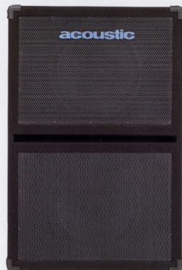
SPEAKER TR-215BX ¥180,000