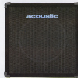
SPEAKER TR-118B ¥160,000