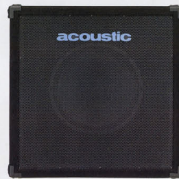
SPEAKER TR-115B ¥120,000