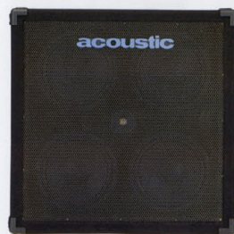
SPEAKER TR-410BT ¥140,000

伝統のアコースティック・サウンドを継承したバスレフ・タイプ・キャビネットのスピーカー・シリーズ。堅牢なキャビネットとアコースティック・ラック独自のレフレックス・チューニングは飽和特性に優れ、アコースティック・サウンドの真髄といえるワイド&ワイドな重低音をパワフルに再生します。