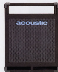
COMBO SPEAKER TR-115CB ¥80,000