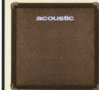
SPEAKER TR-115B ¥120,000 ●SIZE:W710,(D)380,(H)720mm ●WEIGHT:29kg