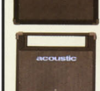
SPEAKER TR-215BX ¥180,000 ●SIZE:W680,(D)510,(H)1100mm ●WEIGHT:57kg