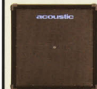
SPEAKER TR-410BT ¥140,000 ●SIZE:W710,(D)380,(H)720mm ●WEIGHT:37kg

伝統のアコースティック・サウンドを継承したバリアス・フレイブ・キャビネットのスピーカー・シリーズ。堅牢なキャビネットとアコースティック・社独自のレフレックス・チューニングは能率特性に優れ、アコースティック・サウンドの真髄といえるワイド&ワイルドな重低音をワフルに再生します。