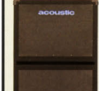
SPEAKER TR-118B ¥160,000 ●SIZE:W710,(D)380,(H)720mm ●WEIGHT:34kg