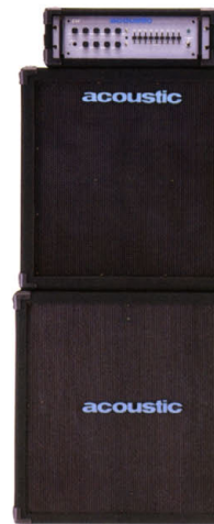
B-400 + TR-410BT + TR-118B

1970年代から1980年代にかけて多くのアーティストに愛用されていたアコースティック・ベース・アンプ。CLASSIC SERIES 370Jはその中でも最も人気の高かったモデル370J (ジャコバスト)アンプの使用で知られるモデル360からアンプ回路等が取り除かれたモデル)の復刻モデルです。復刻モデルではありませんが現在のアプリケーションに対応するため、外見は3Uラック・マウント・タイプ、200W/1イワ・アンプ、空冷ファンを装備。オリジナルと同じコントロールを再現することにより独特の結りあるミッドレンジ・サウンドを再現させています。 ●SIZE:W482,(D)315,(H)132mm ●WEIGHT:17kg