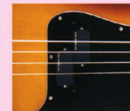
F.G.I.-P ¥13,000 F.G.I. x 1. IV アッセンブリ

F.G.I.ピックアップシリーズは、ワイドレンジ、ローノイズ、ハイパワーが特徴のアクティブ・ピックアップ(ローインピーダンス・ピックアップ)。専用設計の各種部品を使用し、巻きの素材には無酸素鋼を採用、また新設計のプリアンプを通して出力することにより、完璧度がさらに高まっている。クリアでブロードな高音域とタイトな低音域をもつサウンドキャラクターは、発売以来10年以上の間に各種改良を重ね、さらに洗練されたといえる。ギター用シングルコイル(S)、ハムバッカー(H)、ベース用PUタイプ(P)、Jタイプ(J)をそろえ、各組み合わせにより4種類のセットが用意されている。