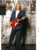
Adrian Belew KING CRIMSON