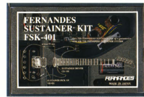
FSK-401 ¥40,000 (取付加工費別) 対応内容: 648mm Scale, 21F, or 24F (ex FR, FGZ...) 628mm Scale, 21F, or 24F (ex MG, LS, H...) 609mm Scale, 21F, or 24F (ex TEJ, ST...) キット内容: リバーシブル・ドライバー (CD-100F) サステイナー・サーキット 専用リアハムバッカー (VH-401, フェライト系ハイゲイン・タイプ) バッテリーボックス 9Vバッテリー

※ドライバー (CD-100F) の取付ボジションはフロント・ネック側になります。 ※FSK-400, 401の取付および加工に関しては、特別な技術が必要となります。詳しくはフェルナンデス・サステイナー サービス係までお問い合わせください。東京: 03-3950-113 大阪: 06-374-2929