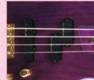
F.G.I.-PJ ¥22,000 F.G.I. x 1. F.G.I.-P x 1. 2V-1Tアッセンブリ