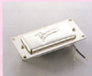
GMH-220 ¥12,000 Burnyシリーズ用に専用設計されたモデル。カバードタイプでありながら優れたハーモニックポイントを提供することができる。コイル・ターン数を十分に設定することにより、輸出の品質を維持したサウンドが得られる。また、GMHシリーズに特長によるモルディング処理を施してあり、ハウリングに非常に強いのが特徴。