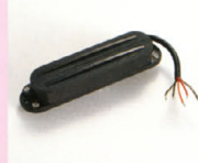
VH-7 ¥11,000 シングルコイルサイズのハムバッカー。強力なTPA-巻取り、太く、線径のあるトーンコイルにより、この形骸に持つたハムバッカー一種は、この形骸をローインプットで実現している。太く、つややかなサウンドの特徴で、クリーン・トーンにも対応する幅広い応答性を待っている。(フロント用(TB-1)、リア用(TB-2)の2種類の用意されている。(特殊バロフィン加工によりハウリング対策済み)