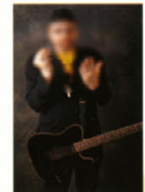
Rick Nielsen CHEAP TRICK