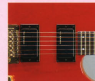
F.G.I.-H ¥12,000 F.G.I. x 1. IV アッセンブリ