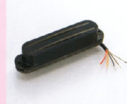
TB-1, TB-2 ¥20,000 VH-4と同様のシングルコイルサイズのハムバッカー種でありながら、シングルコイルにも近い出力をローインプットで実現している。太く、つややかなサウンドの特徴で、クリーン・トーンにも対応する幅広い応答性を待っている。(フロント用(TB-1)、リア用(TB-2)の2種類の用意されている。(特殊バロフィン加工によりハウリング対策済み)