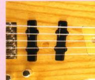
F.G.I.-J ¥22,000 F.G.I. x 2. 2V-1Tアッセンブリ

F.G.I.ピックアップシリーズは、ワイドレンジ、ローノイズ、ハイパワーが特徴のアクティブ・ピックアップ(ローインピーダンス・ピックアップ)。専用設計の各種部品を使用し、巻きの素材には無酸素鋼を採用、また新設計のプリアンプを通して出力することにより、完璧度がさらに高まっている。クリアでブロードな高音域とタイトな低音域をもつサウンドキャラクターは、発売以来10年以上の間に各種改良を重ね、さらに洗練されたといえる。ギター用シングルコイル(S)、ハムバッカー(H)、ベース用PUタイプ(P)、Jタイプ(J)をそろえ、各組み合わせにより4種類のセットが用意されている。