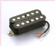
THD-1 ¥13,000 THS-1同様にセラミックマグネットとラージポールピースを組み合わせて、独自のサウンドキャラクターを実現している。シングルサイズの形骸に、フライト・ターン数と強力な出力のあるサウンドから、いままでのシングルサイズではなかったような厚みや広さの音域を可能にしている。(特殊バロフィン加工によりハウリング対策済み)