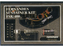
FSK-400 ¥40,000 (取付加工費別) 対応内容: 648mm Scale, 21F, or 22F (ex TEJ, JG...) キット内容: リバーシブル・ドライバー (CD-100F) サステイナー・サーキット 専用リアハムバッカー (VH-400, アルニコ系ハイゲイン・タイプ) バッテリーボックス 9Vバッテリー