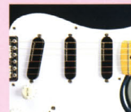
F.G.I.-3S ¥28,000 F.G.I. x 3. IV アッセンブリ