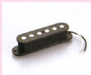
THS-1 ¥11,000 フェライトマグネットとラージポールピースの組み合わせにより、シングルサイズの特性を残しながら、より豊かな音域を実現している。また、ポジション用(逆巻・逆巻)PUの組み合わせによりLow、Midの音域をコントロールしたサウンドならではのハイ・トーンが得られる。(特殊バロフィン加工によりハウリング対策済み)