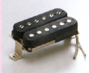
VH-1 ¥12,000 50年代後半のオールPAFのサウンドを生実に再現したモデル。コイル・ターン数、アルニコマグネット形状など、真鍮のデザインになっていて、クリアで、スミス・スミス名義の上下には他に類を見ない。またさまざまなオールワウンドに対応できる。また、(特殊バロフィン加工によりハウリング対策済み)