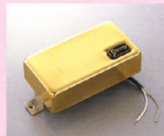
GMH-350 ¥13,000 Burnyシリーズ用に専用設計されたモデル。コイル・ターン数を十分に設定することにより、輸出の品質を維持したサウンドが得られる。また、GMHシリーズに特長によるモルディング処理を施してあり、ハウリングに非常に強いのが特徴。