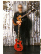
Robert Fripp KING CRIMSON