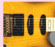
F.G.I.-SH ¥30,000 F.G.I. x 2. IV アッセンブリ、IV アッセンブリ