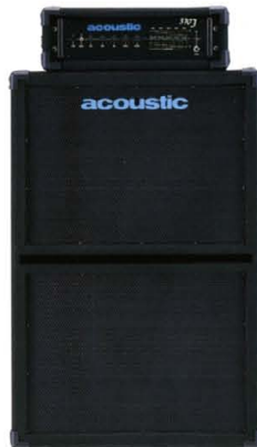
370J + TR-215BX