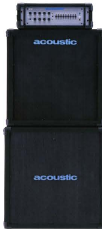
B-400 + TR-410BT + TR-118B

1970年代から1980年代にかけて多くのアーティストに愛用されていたアコースティック・ベース・アンプ。CLASSIC SERIES 370Jはその中でも最も人気の高かったモデル370(ジャコ・パストリアスの使用で知られるモデル360)からアンプ回路等が取り去られたモデルの復元モデルです。復元モデルではありませんが現在のアプリケーションに対応するため、外見は3Uラック・マウント・タイプ、200Wハイ・パワー・アンプ、空冷ファンを装備、オリジナルと同じコイル・ポットを再現することにより独特の粘りのあるミッドレンジ・サウンドを再現させています。 ●SIZE:(W)482,(D)315,(H)132mm ●WEIGHT:17kg