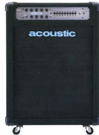
B-200 + TR-410CBT

ベース本来の持つサウンドをロスすることなく出力することと、最近のベース・アプリケーションで求められる多機能の周立を主眼として開発されたバリアス・シリーズ。フラットな状態でのナチュラルな音質、それぞれのベースの持つ特性を生かしたサウンド・メイキング、acoustic独特のプリーミー・ミッド・サウンドなど幅広い音取りが可能。トーン及びイコライザーにはバイパス・スイッチを装備。サウンドの比較や、未使用回路のバイパスが可能。リアパネルにはバリエーション・トリック・コントロール・セレクタ・ブル・エフェクト・ループ、リアアウト、クロスオーバー・アウト・ブット、空冷ファンなど多くの機能が装備されている。そして、多機能ながらもフラットな状態で最高の音質が得られるよう、すべての回路は独立しており、使用しない機能の回路はバイパスされるよう設計されている。 ●SIZE:(W)482,(D)315,(H)132mm ●WEIGHT:18kg