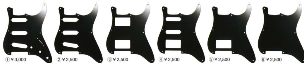
① ¥3,000 ② ¥2,500 ③ ¥2,500 ④ ¥2,500 ⑤ ¥2,500 ⑥ ¥2,500

上記写真の白IP及びSP、黒IP及びGPが基本となります。 ●FRT加工……¥300プラス ●山手ホール加工(1ト)……¥800プラス ●バリエーションホール加工(1ト)……¥500プラス ●ドット・ダブルSWホール加工(1ト)……¥100プラス ●素材変更の場合 ●アルミカラー……¥1,200プラス ●ブロンズ……¥500プラス ●White IP……¥500プラス ①基本となるピックガードの在庫のない場合、入荷まで多少お待ち頂きます。 ②加工の都合上1〜2週間お待ち頂く場合があります。 ③在庫がなく、お急ぎの場合は早急より加工するため、どのタイプでも特価特料金設定となり、多少変動いたします。