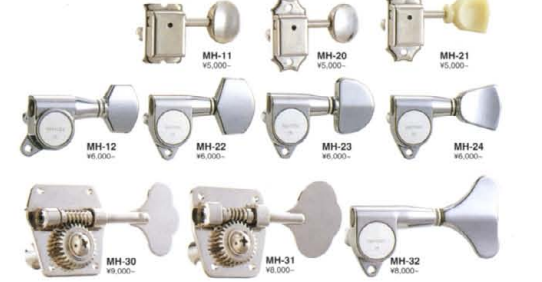
BOOSTER SB-3000 ¥3,000