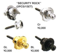
Cr ¥2,000 GL ¥2,500 BL ¥2,500