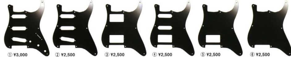
① ¥3,000 ② ¥2,500 ③ ¥2,500 ④ ¥2,500 ⑤ ¥2,500 ⑥ ¥2,500

上記写真の白P及びSP、黒Pは白Pのみの販売となります。(友用は特注) ●FRT加工 --- ¥500プラス ※黒は任意の対応 ●PUホルダー加工 (1カラー --- ¥500プラス ◆アクリルミラー --- ¥1,000プラス ●シール・3ホールド加工 (1カラー --- ¥500プラス ◆ホールド --- ¥400プラス ●ボルト・ドリル加工 (ホールド加工) --- ¥1000プラス ◆3mm (1P) --- ¥500プラス ●PPH止め止め、SPは11点を止め、SP-06は止め、PPD11止めは特注となります。 ○限定となるピックガードの在庫数の限り、入荷まで多少お待たせいたします。 ○加工の都合上、一部の加工は別料金となります。 ○在庫がなくお急ぎの場合は平準より加工するため、どのタイプも特注品価格設定となり、多少お高めになります。