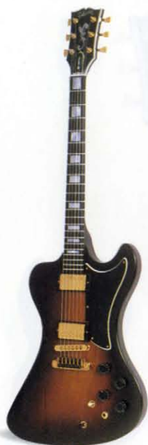
RD ARTIST / 77