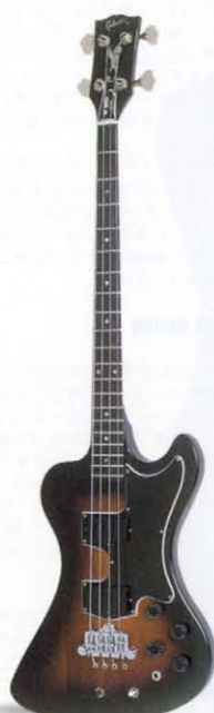
RD ARTIST BASS / 77