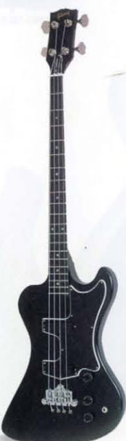
RD STANDARD BASS