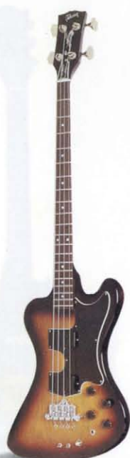
RD ARTIST BASS / 79