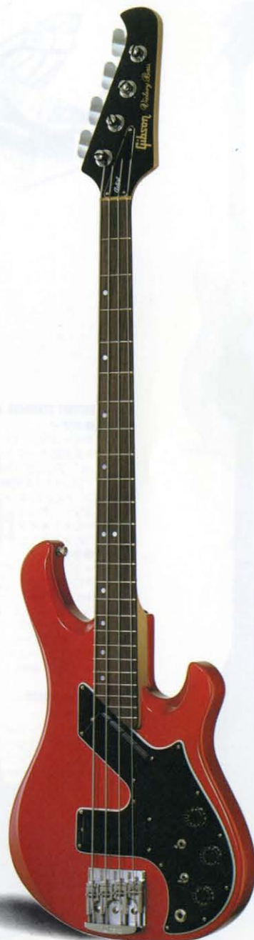
VICTORY ARTIST BASS

Hand guiding through router in shaping the neck