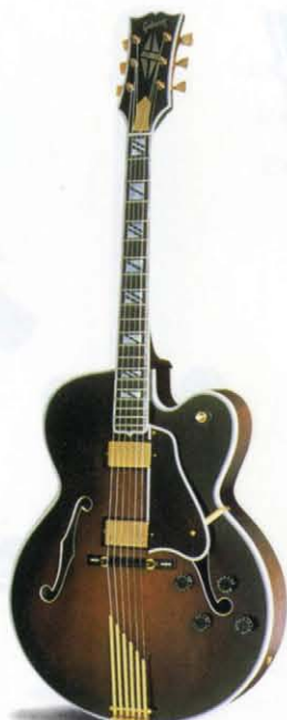
SUPER V CES