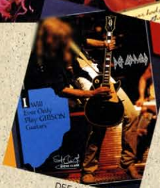
DEF LEPPARD STEVE CLARK