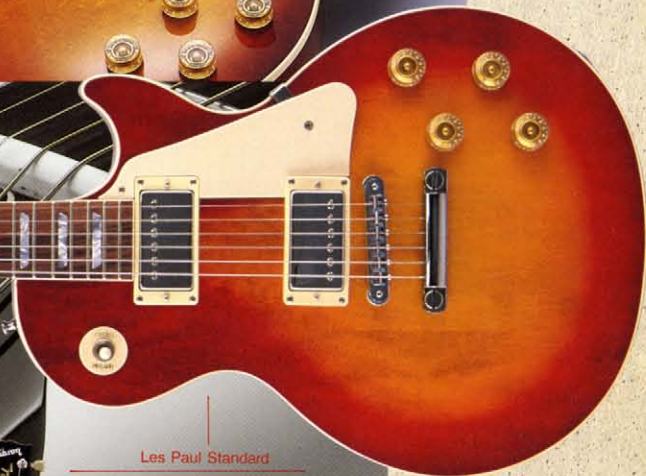
Les Paul Standard