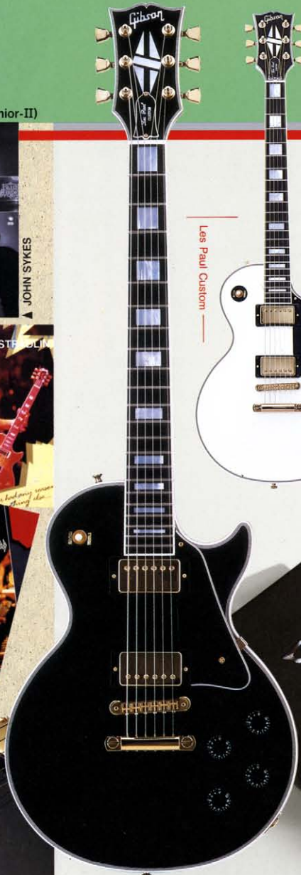
Les Paul Custom