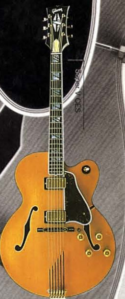
Super V CES