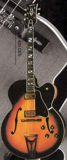
Super 400 CES