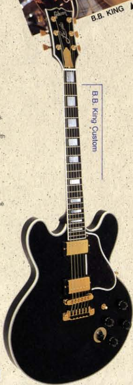
B.B. King Custom