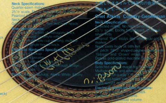
Chet Atkins SST

(Not shown) Same specifications as the Chet Atkins CE with 2-wide fingerboard. (Normal classical neck)