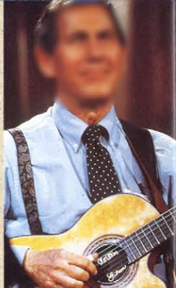
▲ CHET ATKINS