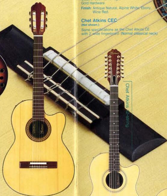
Chet Atkins CE

(Not shown) Same specifications as the Chet Atkins CE with 2-wide fingerboard. (Normal classical neck)