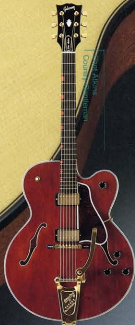
Chet Atkins Country Gentleman

Electrical/Hardware Specifications: 1R-2, 1L-6 humbucking pickups Controls: 1-volume, 2-tone with black knobs, 3-position pickup selector switch, Gold-plated Tune-o-matic on ebony bridge base. Multiple black and white binding tortoise shell pickguard. Body-side Jack Finish: Wine Red, Ebony, Country-Gentleman Brown, Sunrise Orange.