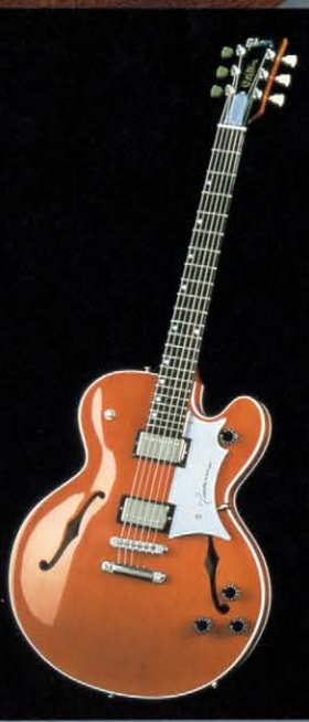
Chet Atkins Tennessee

Multiple black and white binding tortoise shell pickguard. Body-side Jack Finish: Sunrise Orange, Wine Red, Country- Gentleman Brown, Sunrise Orange.