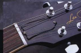
トラス・ロッド・カバーは白いフナドリのない特別なものを使用している。