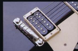
54年製の特徴であるバー・ブリッジ。ピックアップはバーストバッカーが搭載されている。