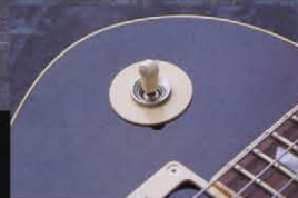
通常はRHYTHM、TREBLEと刻まれているピックアップ・セレクター・プレートだが、本番には何も文字の入っていないタイプが使用されている。