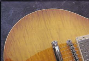
普及なまでにトラ目が浮き出た美しいボディ・トップ。上質のメイプルが入手できた時だけ、このギターは製作されるという。

ビンテージ・バースト特有の外周の赤みが褪せてレモン色に着色している様子を見事に再現している。