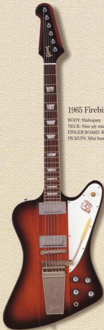
1965 Firebird V VS

BODY: Mahogany NECK: Mahogany FINGER BOARD: Rosewood PICKUP: 57Classic