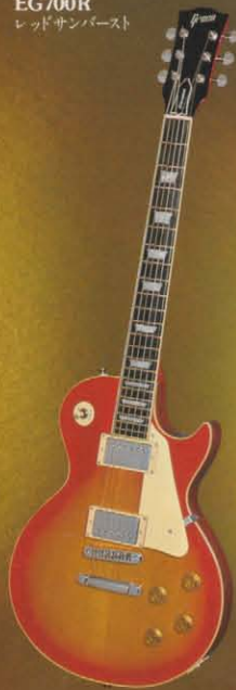
EG700R レッドサンバースト