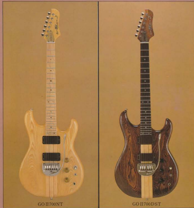
GO II 700 NT

GO II 700仕様: ボディ/セン単板 ネック/メイプル+マホガニー・スピードウェイ 指板/メイプルまたはローズ 糸巻/SD81-05M ピックアップ/ハムバックキング×2 トレモロユニット付またはテンションアジャスター付 カラー/GO II 700 NT、GO II 700 DST、GO II 700 RT、GO II 700 N、GO II 700 DS、GO II 700 R 専用ハードケース ¥10,000