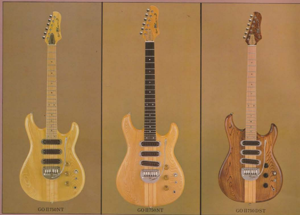
GO II 750 NT