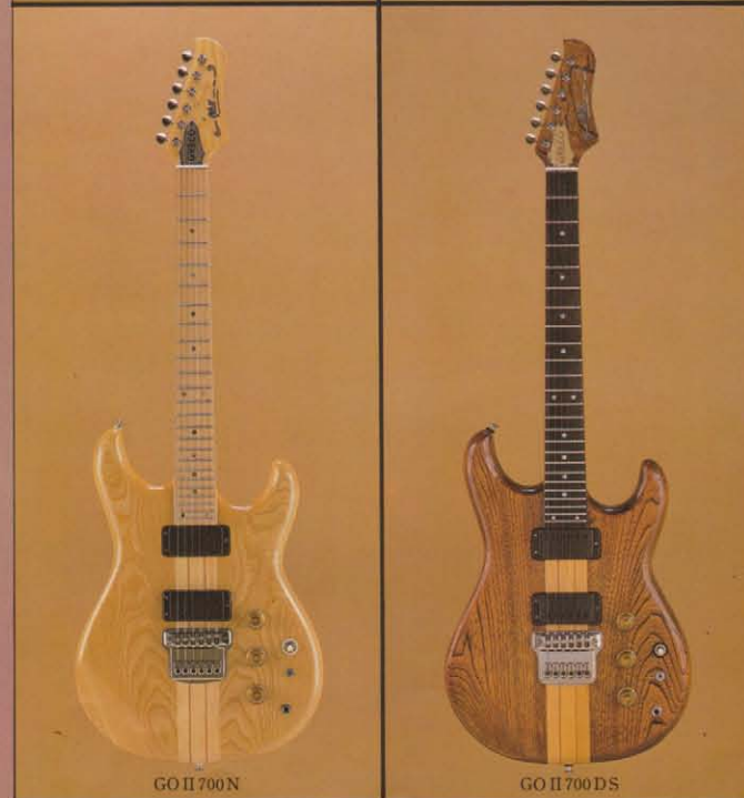
GO II 700 N