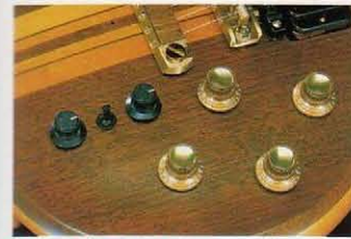
●操作性を重視したコントローラーレイアウト

GR-300、GR-100そして今後発売予定のGRユニット全てに互換性のあるユニット接続用の24ピンコネクタです。