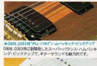
●G808、G303用"PU-114H"ハムバッキング・ピックアップ G808、G303用に新開発したスーパーバランス・ハムバッキング・ピックアップで、ギターサウンドも魅力的です。

主要サーキットを、安定した特性と確かな信頼性のプリント配線によって構成し、各ピックアップからの信号、フィルター類などの信号を確実にコントロールします。