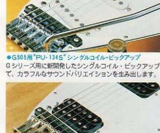
●G505用"PU-134S"シングルコイル・ピックアップ Gシリーズ用に新開発したシングルコイル・ピックアップで、カラフルなサウンドバリエーションを生み出します。