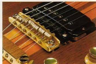
●ヘキサ・デュアルハイテッド・ピックアップ

505はセン単板ボディにメイプルワンピース、またはローズ指板のディタッチャブルネックで、シングルコイル・ピックアップを3基マウント、5ポジション・セレクターによりカラフルなサウンド・バリエーションを生み出す事ができ、さらに安定したモーションで鋭いアーミング効果が得られるニュースタイルのトレモロユニットまでもセットしてあるスーパーファイターなモデル、もちろん、ギター・シンセサイザー・サウンドにも強力なアーミング効果を付ける事が可能となっています。G202はG505のトレモロユニットなしのハムバッカー・マウント・モデルで、Gシリーズ・オリジナルのストレートなハムバッカー・サウンドを生かしたモデルです。ライトウエイトなボディとブライトなハムバッカー・サウンドはそれだけで十分にライブステージのヒーローとなる魅力を持っています。G505とG202にはステージ効果を考えたカラーモデルも用意しており、G505にはサンバーストの他にメタリックレッド、メタリックブルーのフィニッシュが、G202にはナチュラルの他にコーラルレッド、ライトブルーのフィニッシュがあります。G808、G505、G303、G202はGR-300に接続すればギター・シンセサイザーに、GR-100に接続すればエレクトロニック・ギターになります。