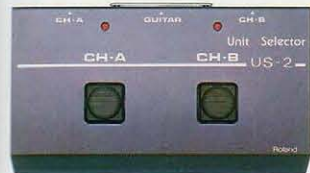
US-2ユニットセレクター ¥22,000

カラーの記号は、NT:ナチュラル、RD:レッド、BL:ブルー、RB:ローズウッド、BS:サンバースト、MR:メタリックレッド、MB:メタリックブルーを示します。 ●GRシステムのIN、PUTおよびOUT、PUTは24Pコネクタで統一されていますのでどのギター・コントローラーも上記のユニットに接続できます。また別売のUS-2を使用すれば1台のギター・コントローラーで2台のユニットを同時に使用できさらに幅広い音作りが可能です。