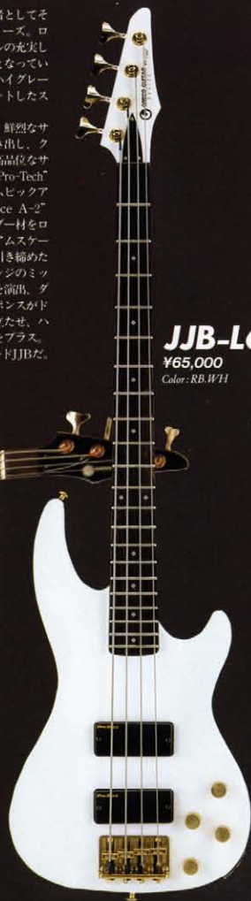
JJB-L65 ¥65,000 Color: RB.WH

ニュースタンダード・ベースの覇者としてその地位を確かなものにしたJJBシリーズ。ロングスケールとミディアムスケールの充実したラインアップもその魅力の一つとなっている。そして、このラインアップにハイグレードなアクティブサーキットをマウントしたスーパーモデルが加わった。 サウンドの要となるシステムには、鮮烈なサウンドイメージを思いのままに描き出し、クリアでフラットなレスポンスを高品位なサウンドエネルギーとして放出する"Pro-Tech"アクティブサーキットと、カスタムピックアップ"Pro-Duce A-1"、"Pro-Duce A-2"をマウント。ボディ材には、アルダー材をロングスケールに、セン材をミディアムスケールに採用し、あくまでもタイトに引き締めたローレンジ、透明感溢れるハイレンジのミックスクラスエキサイティングなトーンを演出、ダイナミックなワイドサウンドレスポンスがドライブするベースラインを一層際立たせ、ハイクラスなベースサウンドに迫力をプラス、強力なクオリティのスーパーグレードJJBだ。