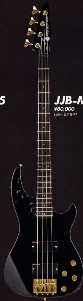
JJB-M60 ¥60,000 Color: RB.WH