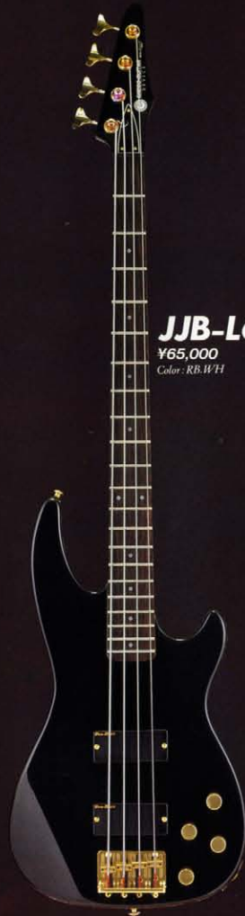
JJB-L65 ¥65,000 Color: RB.WH